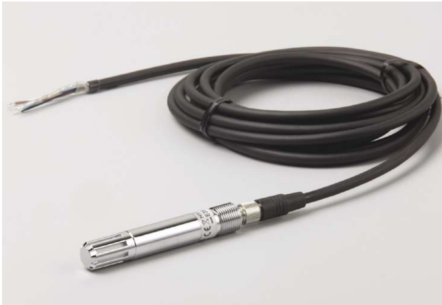
Eine Sonde für härteste Bedingungen.